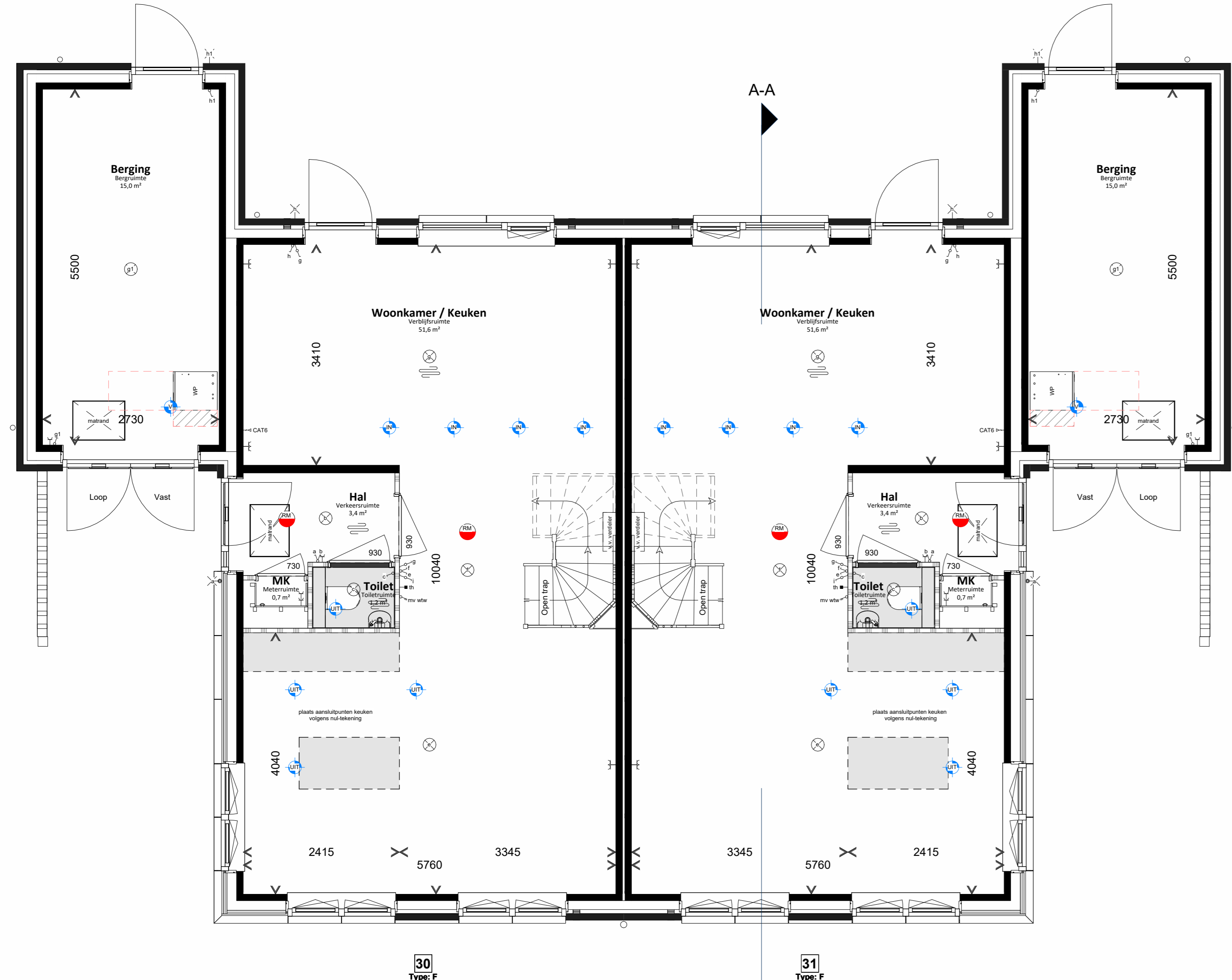
Begane grond 1 : 50