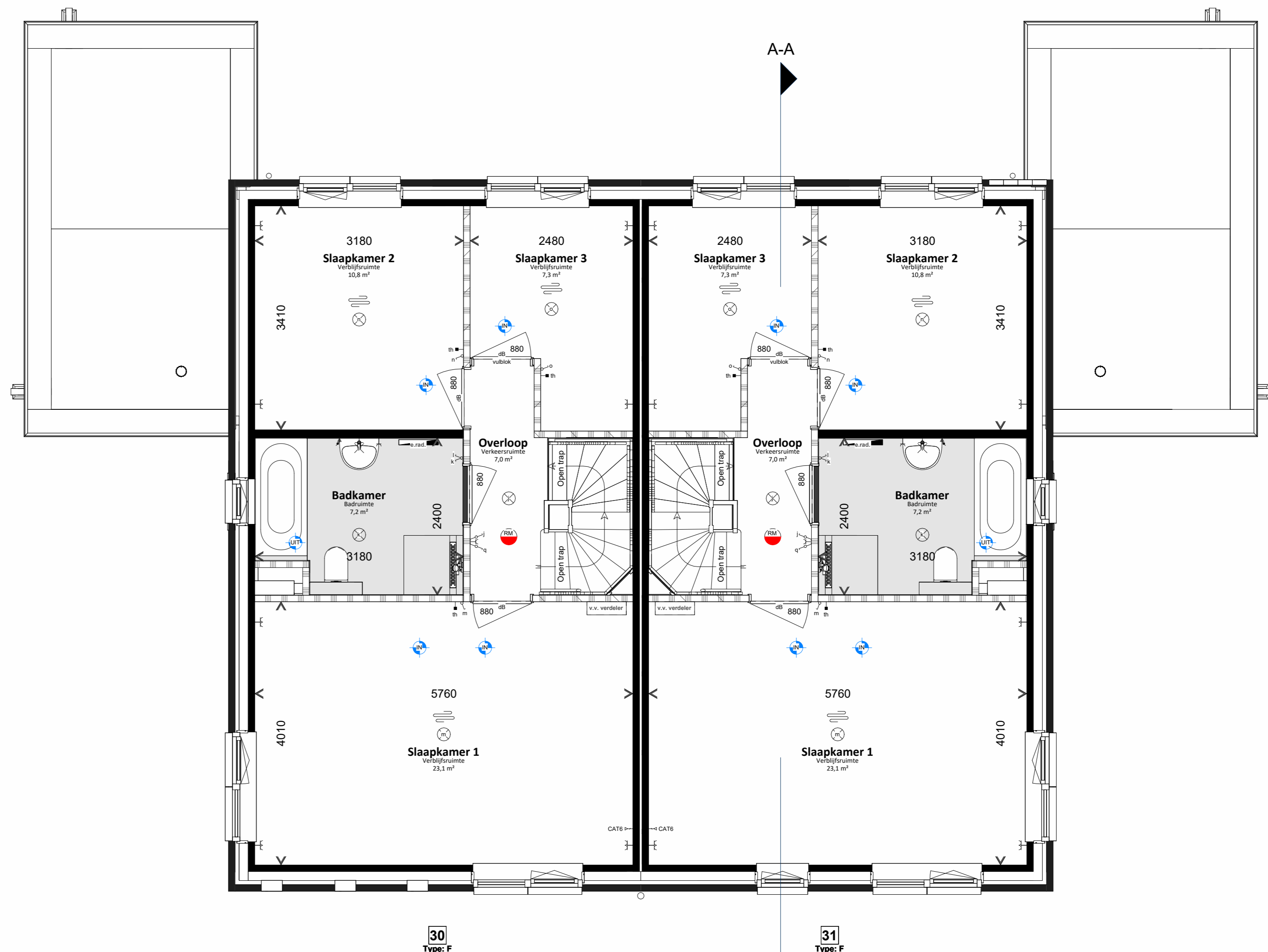
Eerste verdieping 1 : 50