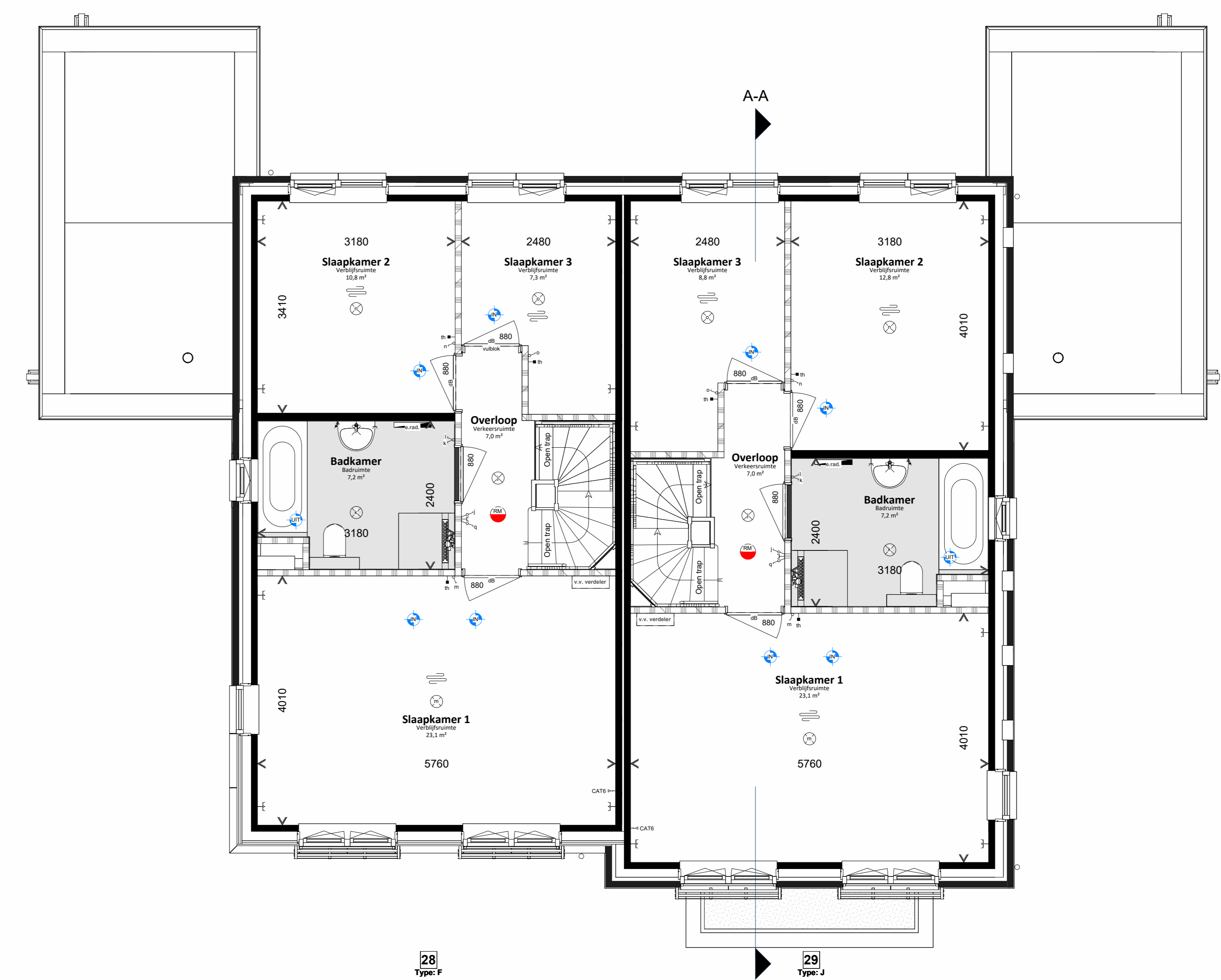
Eerste verdieping 1:50