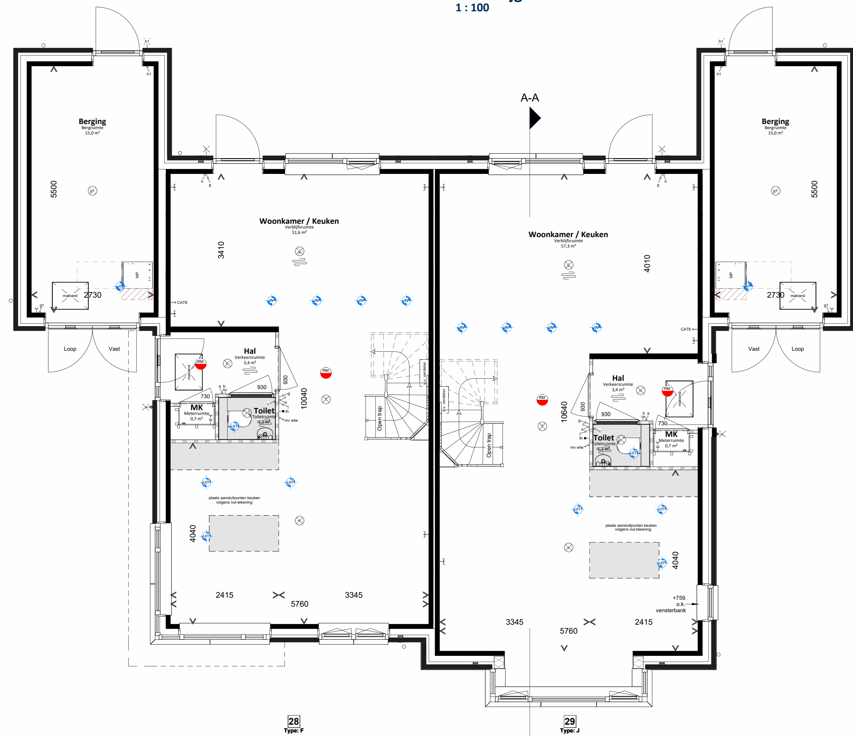
Begane grond 1:50